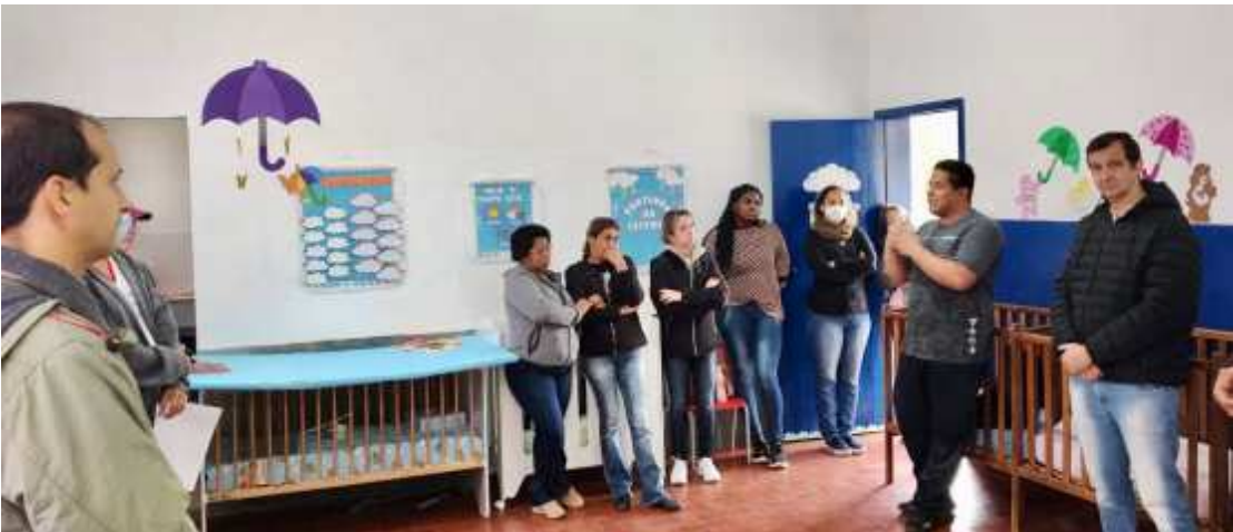
A Escola que passará a funcionar como anexo à Creche Luiz Antônio Rocha Carvalho, foi toda reformada pela Secretaria de Obras a pedido da Secretaria de Educação, Esporte e Cultura.

Objetivando atender o aumento de uma demanda por creche na cidade de Santa Maria Madalena, a prefeitura através da Secretaria de Educação e em parcerias com a secretaria de obras, realizou a reforma na Escola Alaíde Pontes Cypriano, situada no Bairro Largo do Machado. A escola que deixou de funcionar como estabelecimento de ensino desde o ano de 2006, onde era então espaço de utilização do CRAS da Secretaria Assistência Social. Mas estava fechada desde o ano de 2019 e foi reaberta este ano na data de 22 de Agosto com a estrutura física de projeto para atender a Educação Infantil. "Quarenta e cinco com até 03 anos de idade, distribuídas em turmas de berçário e maternal que estavam na fila de espera, agora passarão a ser atendidas,"