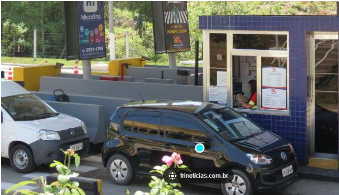
Foram registrados nas cancelas de cobrança da Rota 116 cerca de 130 mil veículos indo e vindo nas estradas do interior, principalmente na RJ 116.

Durante a quarta-feira, equipes da Concessionária Rota 116 trabalham na manutenção da rodovia em quatro pontos, mas o sistema de Pare e Siga só está montado na altura do quilômetro 47, em Cachoeiras