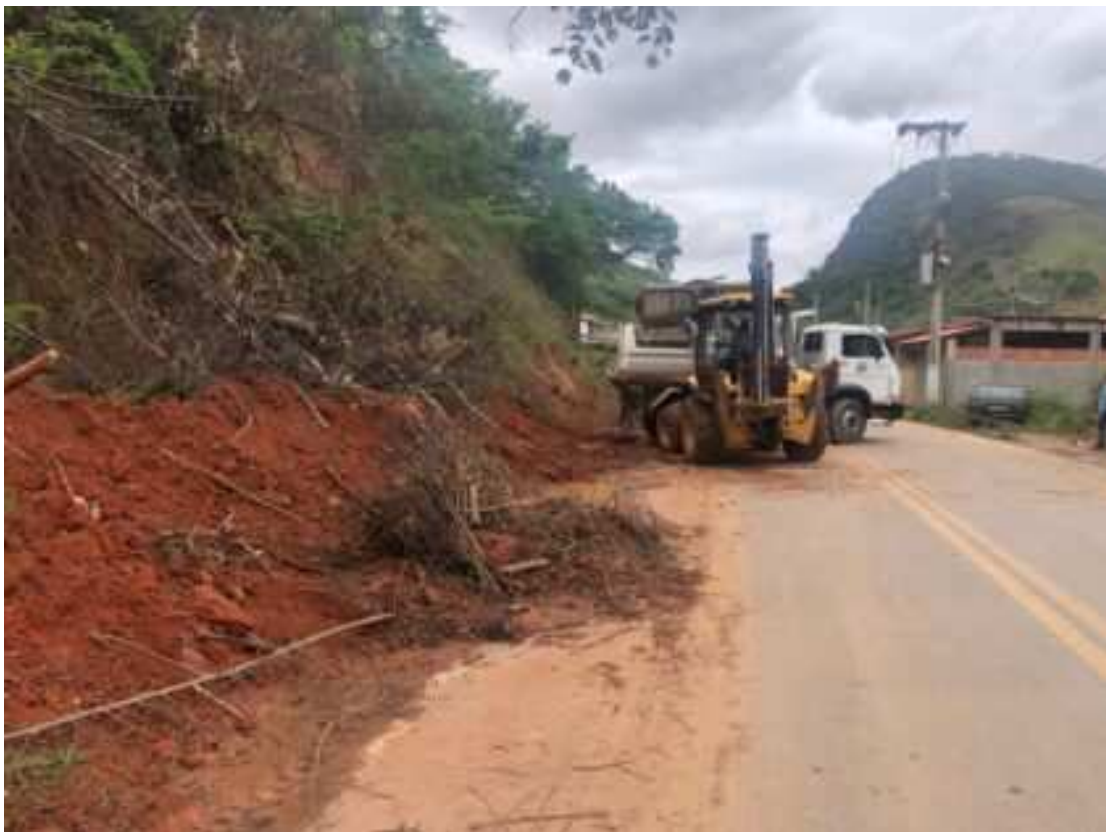
Máquinas e caminhões não para de trabalhar nas estradas do município

A estrada que liga as localidades de Barra dos Passos e Lagoinha foi outra que recebeu