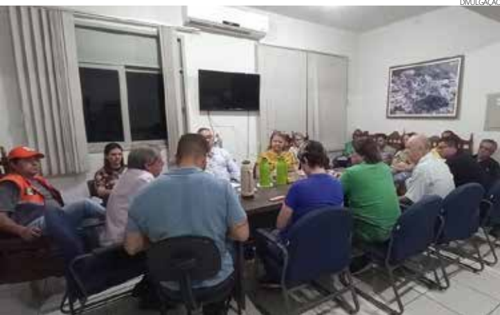
A reunião aconteceu no gabinete do prefeito

serem executados em diversas áreas do município, especialmente na Saúde com o lançamento da pedra fundamental que marca o início das obras do novo hospital municipal, com a presença do Governador do Estado do Rio de Janeiro, Thiago Pampolha, na próxima quinta-feira, 11 de maio, às 12 horas. “Esses encontros são importantíssimos para o alinhamento de toda a equipe em torno dos objetivos