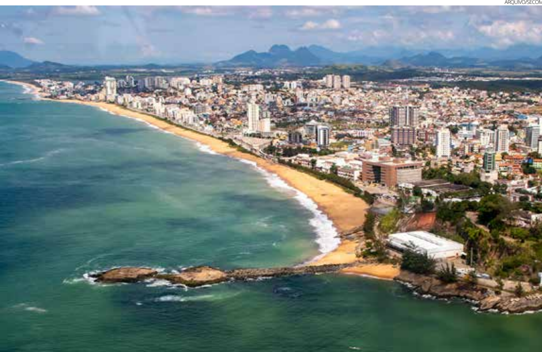
Projeto consolida a referência de Macaé como o principal polo produtor de gás e de geração de energia do país