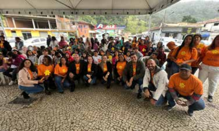
Para prestigiar a apresentação além de crianças diversos secretários marcaram presenças no evento