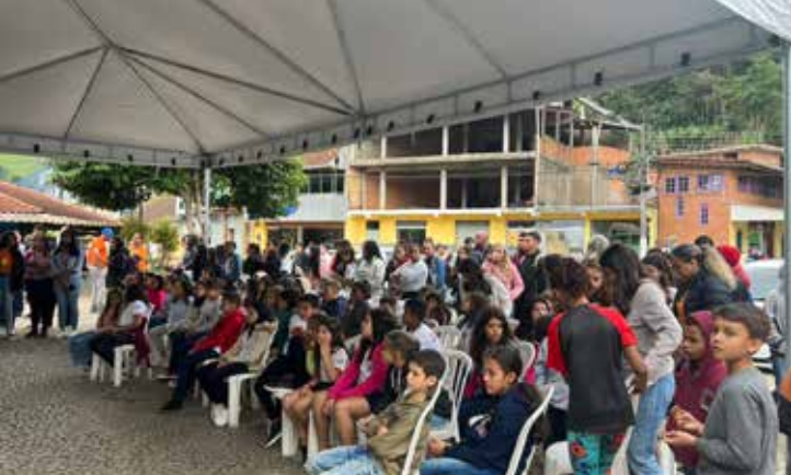
O evento reuniu muitas crianças além de autoridades do município de Trajano