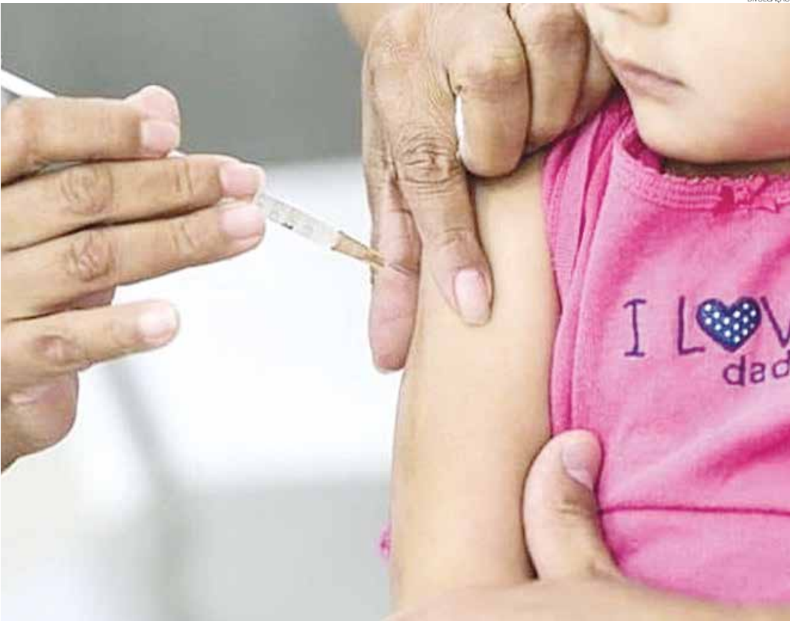
A partir de agora, a vacina oral poliomielite bivalente (VOPb), conhecida popularmente como "gotinha", será substituída pela vacina inativada poliomielite