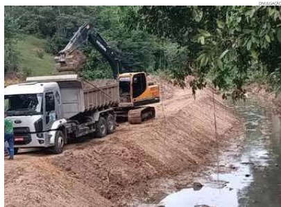
O Programa Limpa Rio é um projeto do governo do Estado do Rio