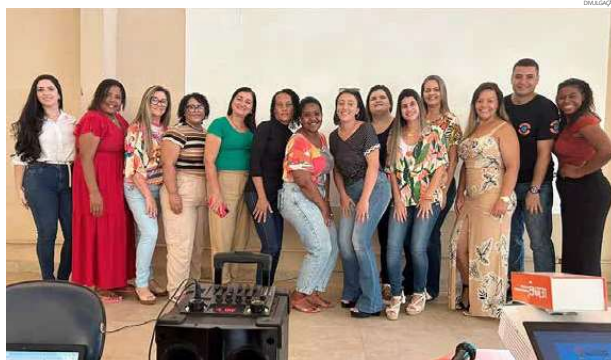
Secretaria de Saúde reúne enfermeiros e técnicos para aprimorar técnicas