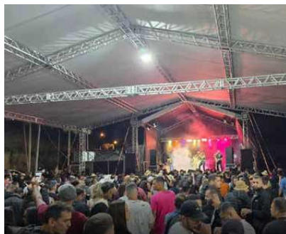
Os shows realizados com grande participação do público

Após o café, foi dada a largada para o passeio de trilha.