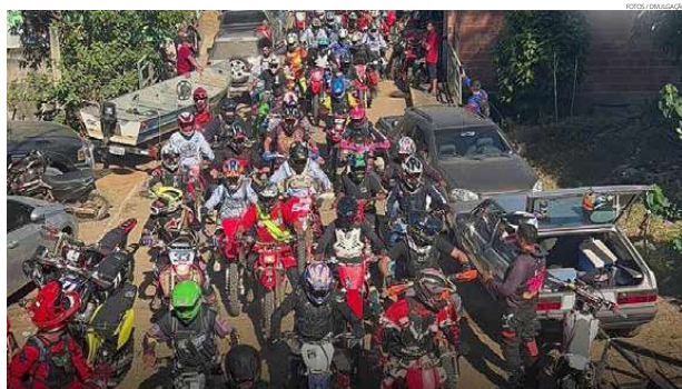
O Trilhão foi um dos principais sucesso da festa realizada em Maria Mendonça

Os participantes foram recebidos com um delicioso café da manhã, composto por frutas típicas da nossa região.