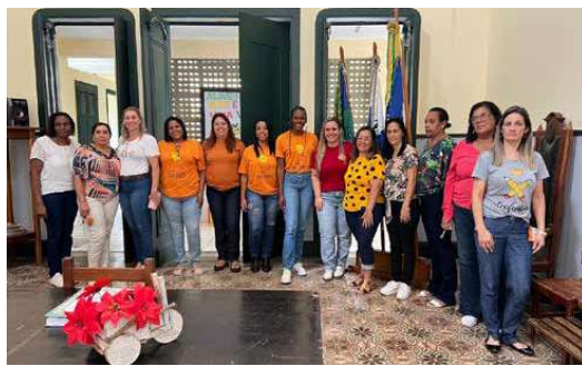
Ação realizada pela secretaria Municipal de Assistência Social de Trajano de Moraes contou com a participação de diversas comunidades

A secretária da Social ainda falou sobre as ações que vêm sendo desenvolvidas durante todo o ano e alertou sobre a