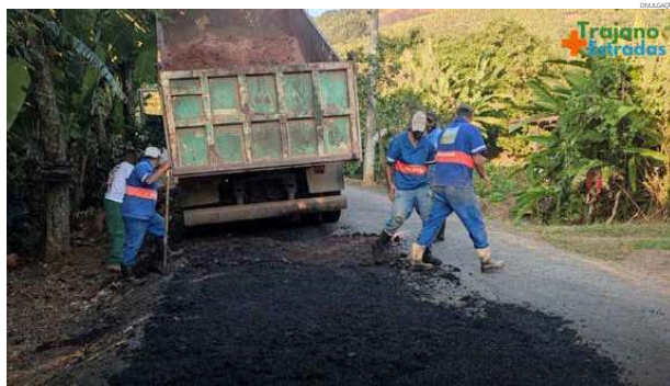
A secretaria municipal de Estradas e Rodovias está realizando uma Operação Tapa Buraco

"Estamos realizando a Operação Tapa Buraco nos pontos mais críticos e continuaremos nas ruas que necessitem dos serviços. O objetivo é deixar as ruas em condições seguras para o trânsito de veículos e pedestres", disse o prefeito Rodrigo Viana.